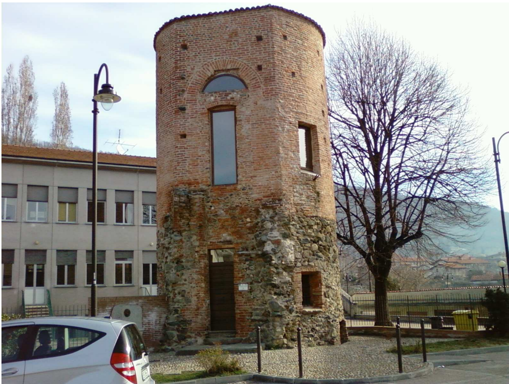
Torre Angolo nord est Punto di Accoglienza Turistica - Piazza Lucca