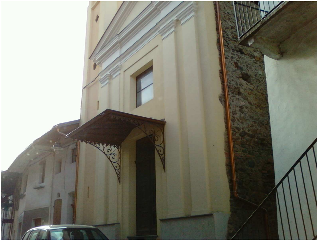
Chiesa della Confraternita - Via G. Flecchia