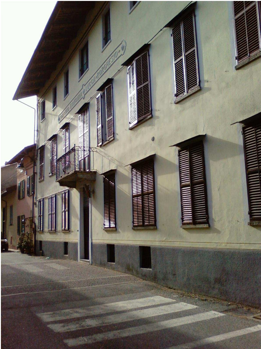
Fabbricato oggetto d'intervento