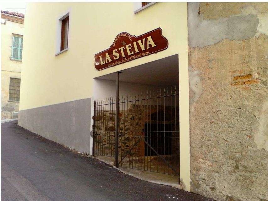
Museo "La Steiva"