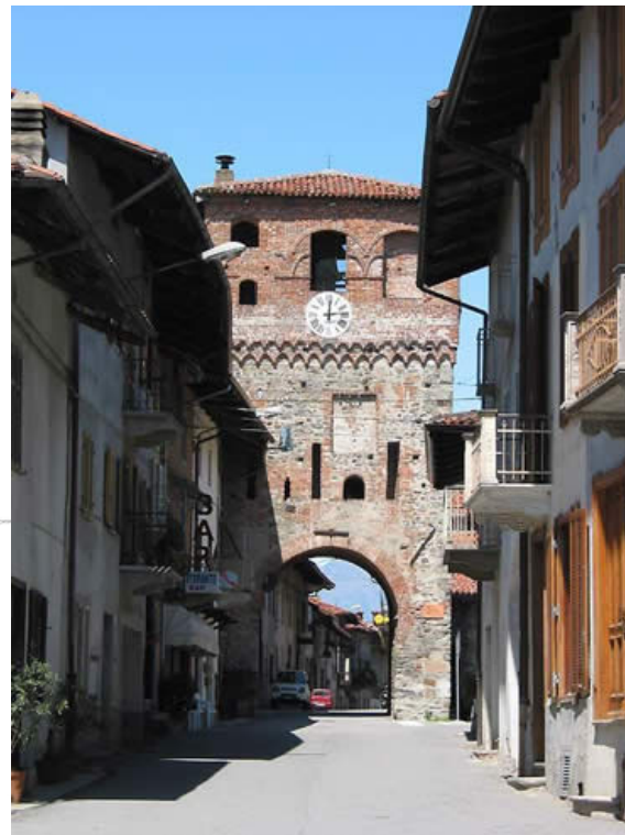
La Torre porta come appare oggi